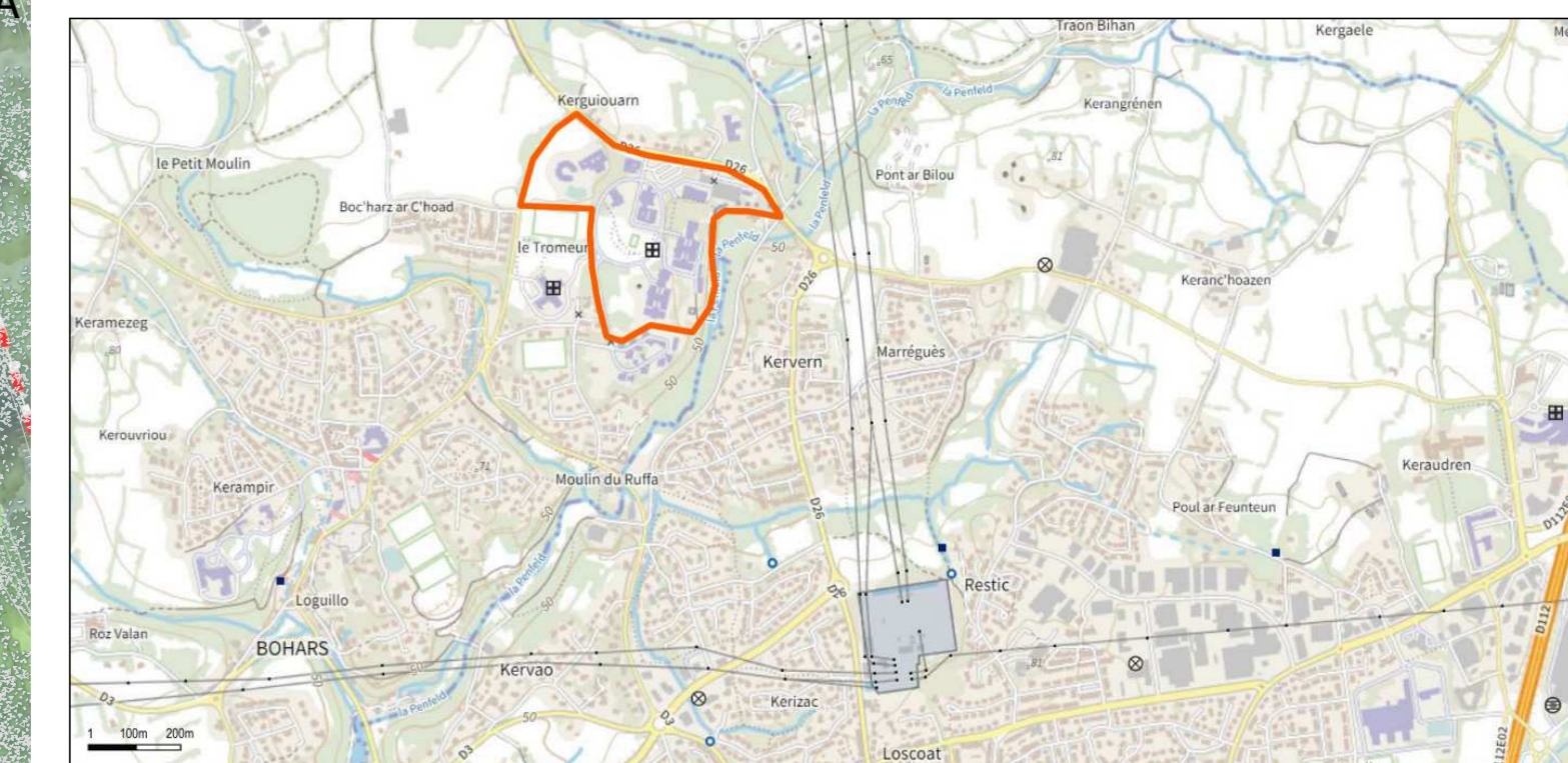
PC1 PLAN DE SITUATION DU TERRAIN