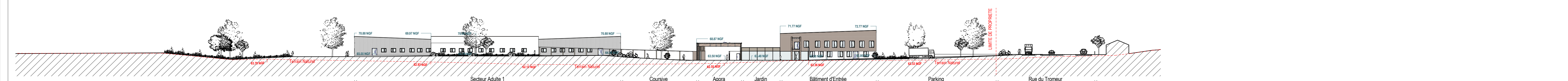
PC3 PLAN EN COUPE DU TERRAIN ET DES CONSTRUCTIONS BB-NORD-SUD Echelle : 1 : 500